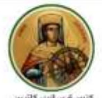
كنيسة سانت كاترين