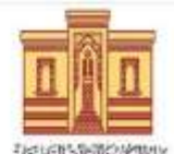
دار الكتب المصرية